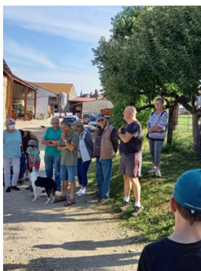
Visite chez Les Eleveurs de la Côte Verte