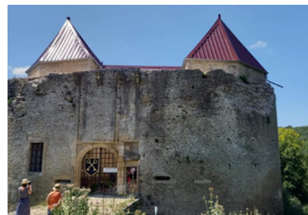
Visite du château de Rochefort