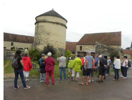
Visite de Senailly