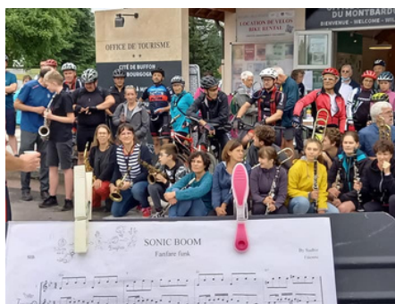
Balade des Corps Creux

Pour plus de détails, cf. le bilan de saison en annexe.